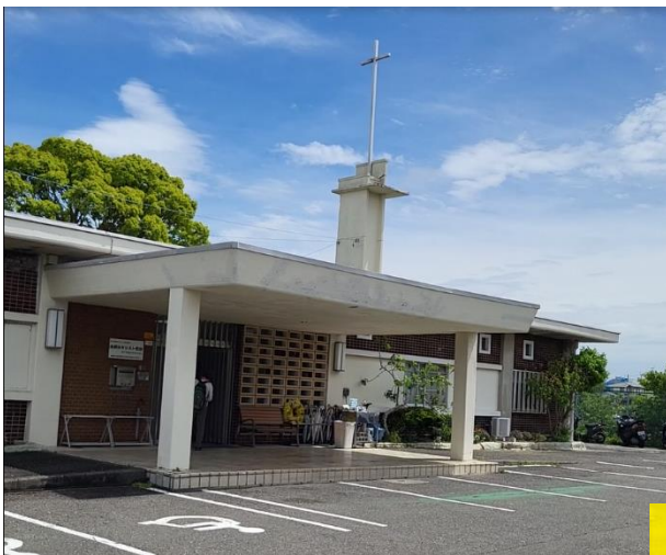
本鄉台基督教會外觀

已跟教會同工溝通，待我新居安頓後，我便可以投入教會的事奉。教會的異象宣言是“Mission 3000”，意念取自使徒行傳二章，初期教會在一日間增加了 3000 名門徒的歷史。教會希望不單是能在人數上有迅速增長，還希望這 3000 人是能如初期教會般被差出去，在本地或世界宣教上產生影響力。教會初步會安排我在「宣教部」工作，接替一位於 5 月頭離職的同工；宣教部是教會特有部門，異象是推動弟兄姊妹外出宣教，或接待肢體前來訪宣，這與我的異象不謀而合，所以大家都覺得上帝帶領我由關西轉來橫濱是有祂美好的心意。十分期待與這教會配搭，共同推動宣教工作，請為我們有良好的合作關係禱告。