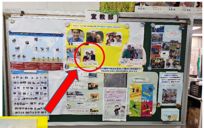
本鄉台教會「宣教部」壁報板