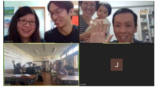
在線上與 Jesus House 牧者及弟兄姊妹會面分享

雖然未能親身到日本教會與弟兄姊妹一同團契相交，但感恩仍能透過網絡在滋賀縣教會 Jesus House 的主日崇拜中與久未見面的牧師和肢體會面，彼此分享近況和代禱祝福。參與者還有在 2018 年與我去完訪宣後，有感動再去 Jesus House 服侍三個月的姊妹及其丈夫。盼望藉著網上會面，繼續維繫香港信徒與日本教會的關係，令當地教會感到被支持及不被遺忘。