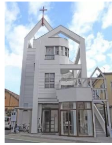
守山基督福音教會

自 2016 年開始，我曾多次帶領弟兄姊妹到滋賀縣守山基督福音教會和 Jesus House 服事，也認識了關西地區不少香港宣教士。雖然現身處關東，但也會想念這些友好的教會和宣教伙伴。適逢守山教會今年踏入 50 周年，我們一家決定於 11 月 26 日至 12 月 3 日前往關西，一方面出席其 50 周年紀念崇拜，另一方面也會探訪 Jesus House、香港宣教士們以及其他教會等，期望此行能深化彼此情誼，及擴大關西一帶的網絡，將來能繼續支援這一帶的教會。