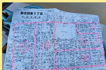
每周派單張路線圖