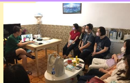
開放我家接待弟兄姊妹及 分享宣教異象

最近有數不盡的機會與不同的群體或個人分享我們一家的長宣心志，除了親身到教會分享外，我們也經常邀請不同弟兄姊妹來我的新居作客，並聽我們分享（實在看到神為我們預備這家的美意）。每次分享都充滿著鼓勵，也感到弟兄姊妹的支持，實在感謝主的恩典！求主保守這家繼續成為盛載祝福的地方，並能激勵弟兄姊妹一同參與宣教。