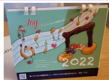
送贈日本教會的 2022 年基督教月曆

雖然未能親身到日本服事，但我嘗試以遙距方式繼續支援日本教會，如早前曾為兩間教會籌款，支援他們在疫情下的事奉。最近，從另一香港姊妹得知，日本一些有心人願意免費送贈 2022 年的基督教月曆給眾教會，我便一口氣聯繫了多間友好的日本教會，大部份都表示有興趣。他們在收到月曆後，都大讚製作精美，並希望能在教會聖工上用得著，我也為能遙距幫到他們一點而感恩呢。